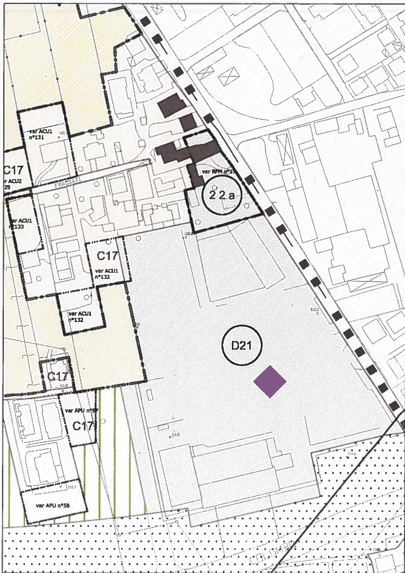
STRALCIO TAVOLA 13.4 ZONIZZAZIONE SCALA 1:2000