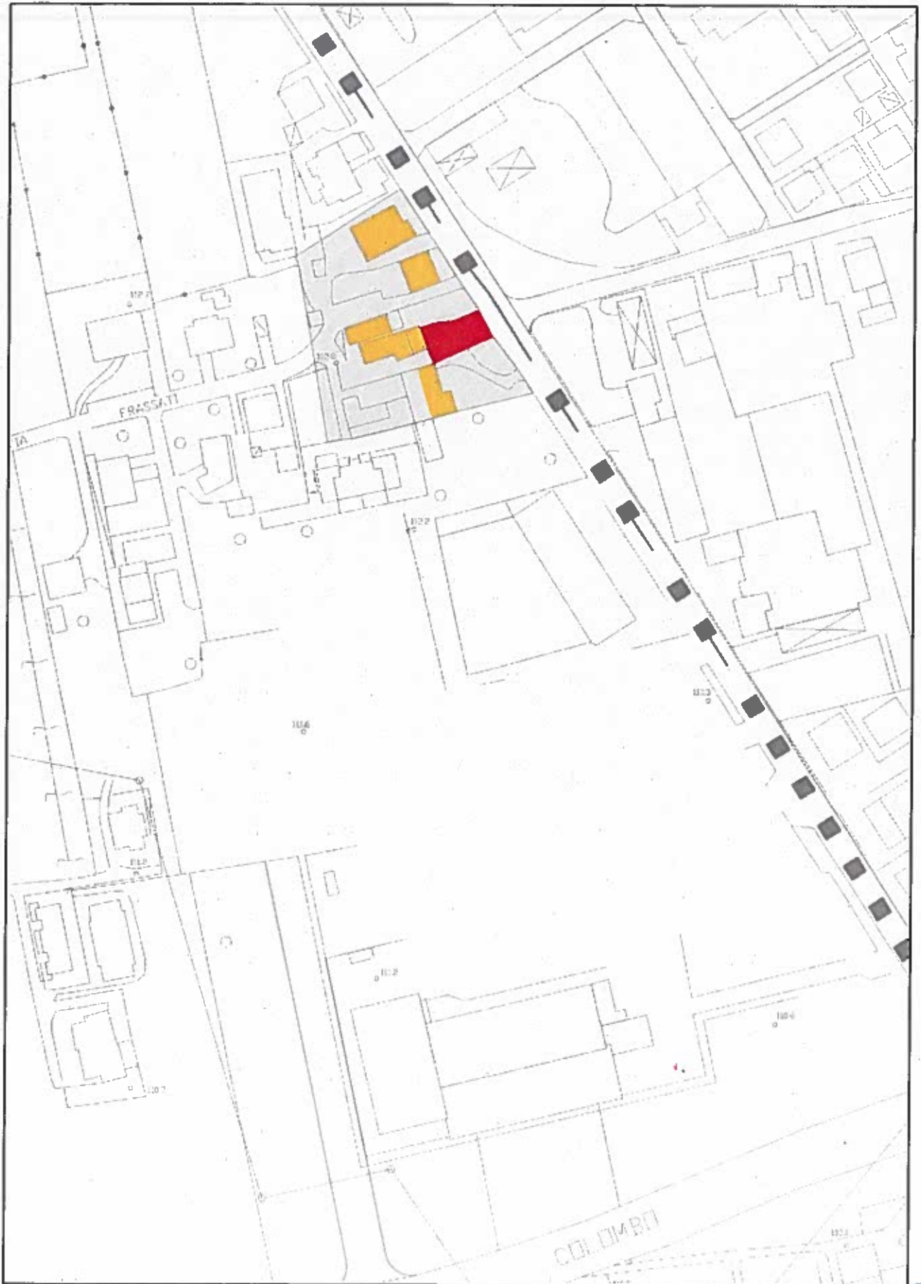
STRALCIO TAVOLA 13.2.1

INVARIANTI DI NATURA CULTURALE ED EDIFICI DI INTERESSE AMBIENTALE - INTERO TERRITORIO SCALA 1:2000