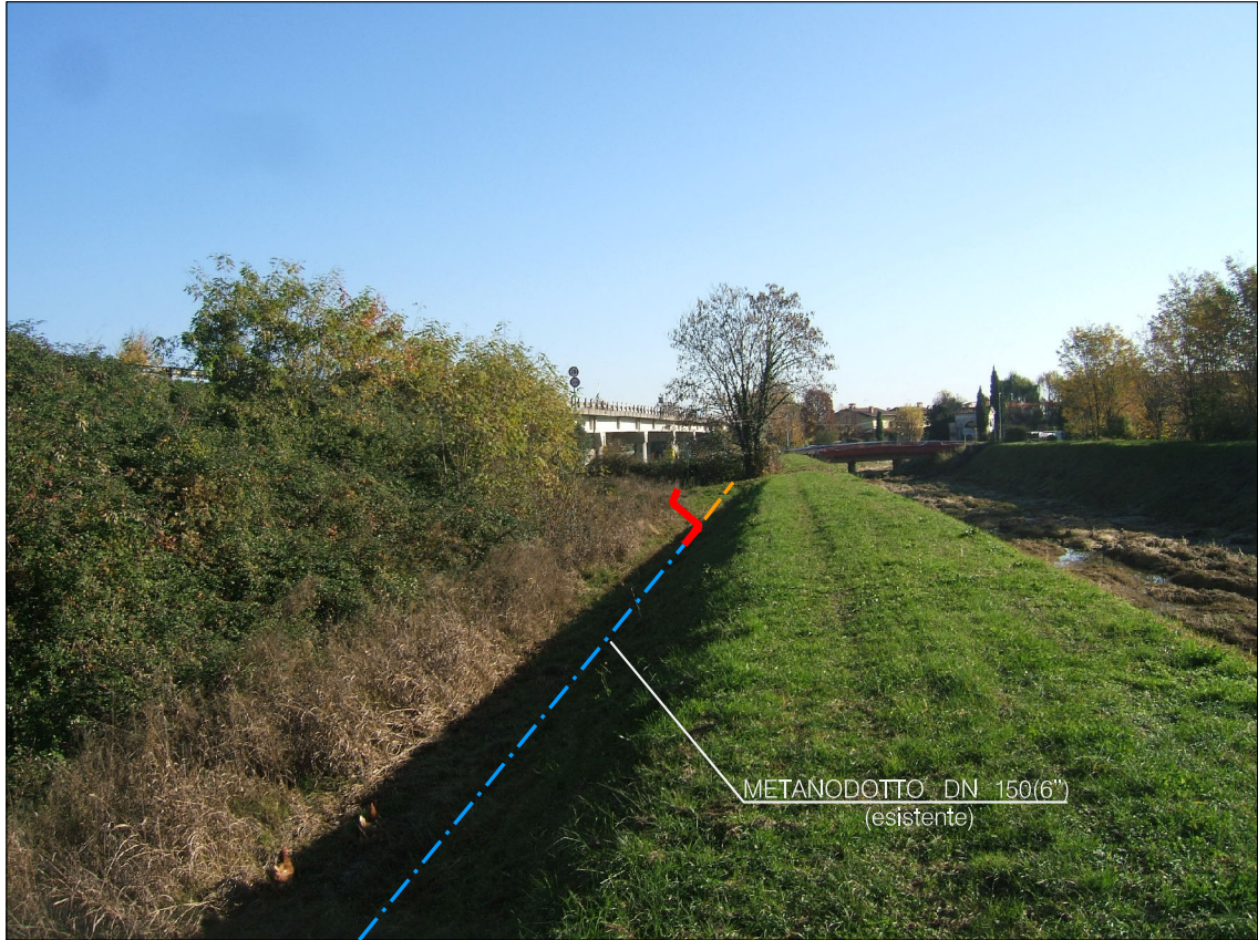
Vista panoramica del punto di collegamento a fine variante