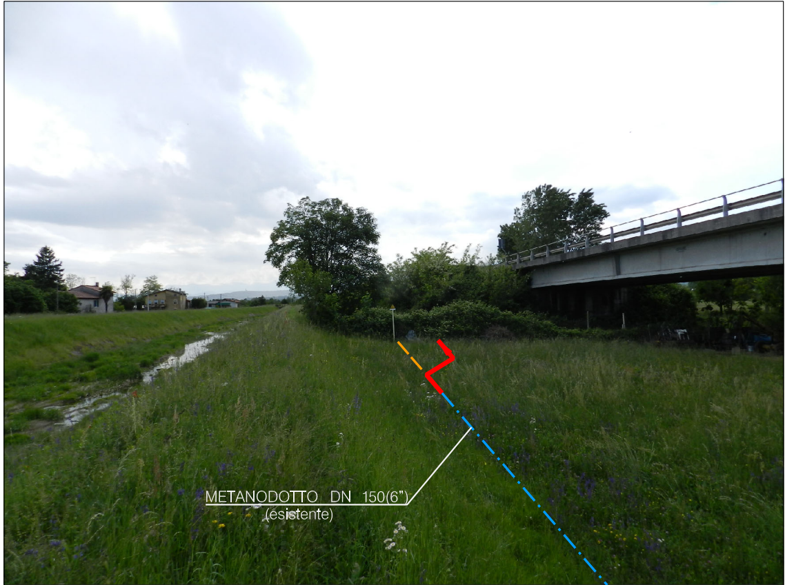
Vista paronamica del tratto iniziale.