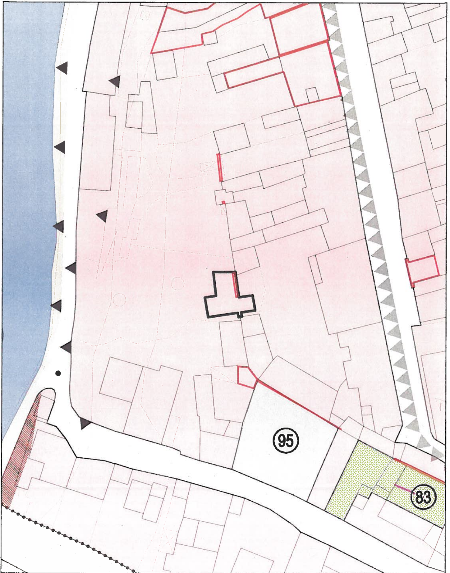
STRALCIO TAV.20 ZONIZZAZIONE area interessata dalla Variante ———